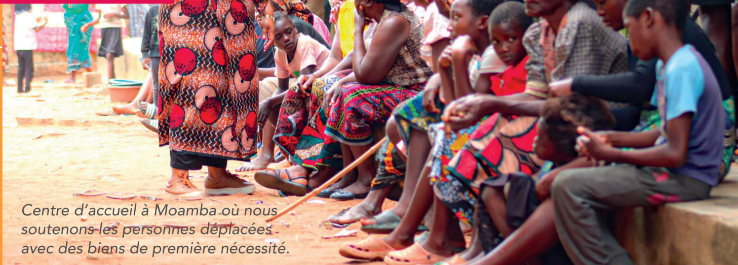
Centre d'accueil à Moamba où nous soutenons les personnes déplacées avec des biens de première nécessité.